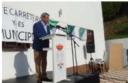
Alcalde de Fuente Carreteros