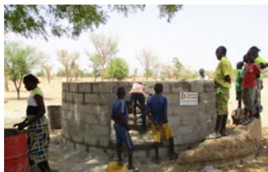
Remodelación del pozo del poblado de Mandoussa