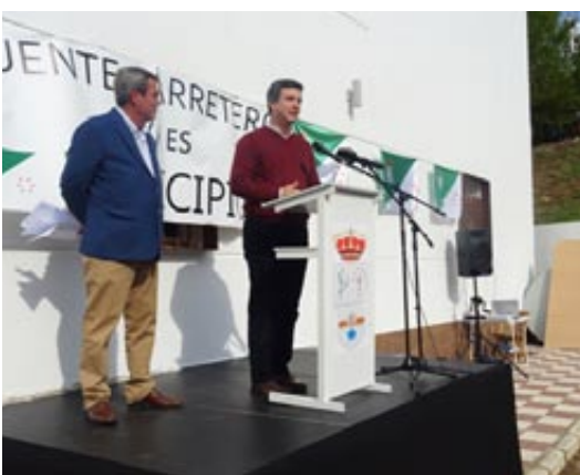
Alcalde de Cañada Rosal