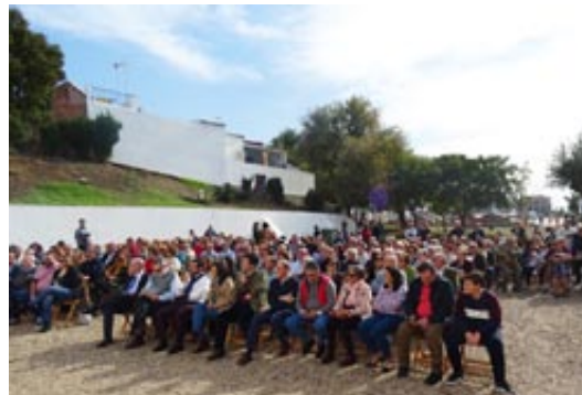
Público durante el acto Institucional