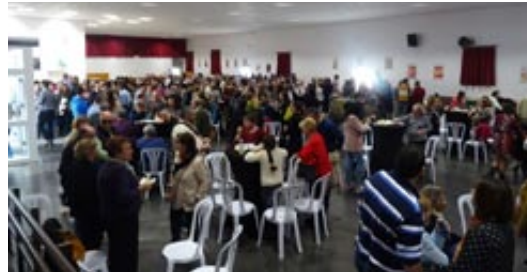
Interior de la Casa Grande