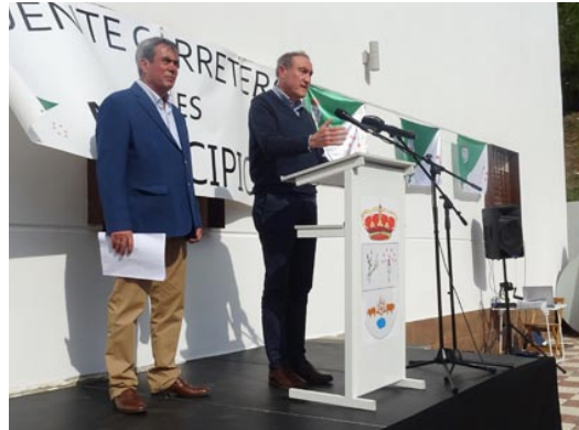
Alcalde de Palma del Río