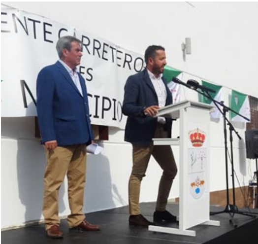
Alcalde de Torre nueva Costa