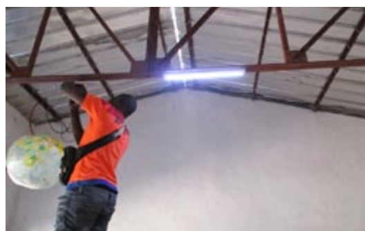
Luz fotovoltaica de una biblioteca