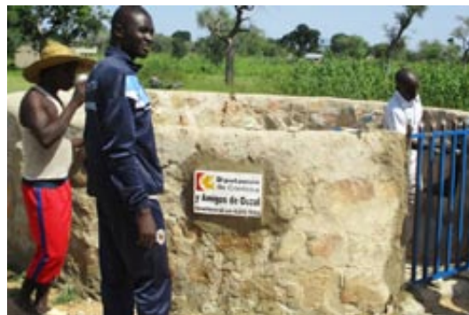
Remodelación de un pozo en uno de los colegios de Ouzal

He aquí algunas de las fotos de los proyectos en marcha.